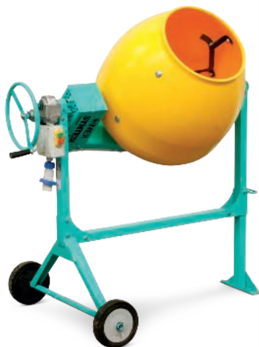
Syntesi 140 HDPE